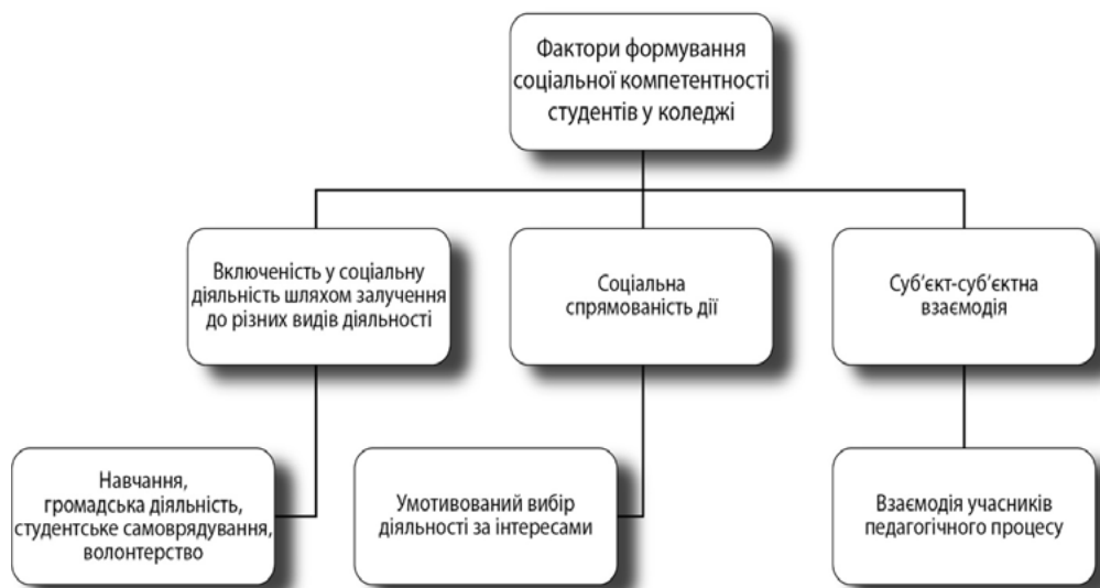
Рис. 2. Фактори формування соціальної компетентності як індикатора соціалізованості здобувача освіти з особливими освітніми потребами

Саме це середовище має слугувати формуванню соціальної компетентності особистості з особливими освітніми потребами як індикатора соціалізованості. Факторами формування соціальної компетентності (за М. Докторович) слугують: освітня діяльність студента, його включення в громадську діяльність, міжособистісна взаємодія тощо (рис. 2).